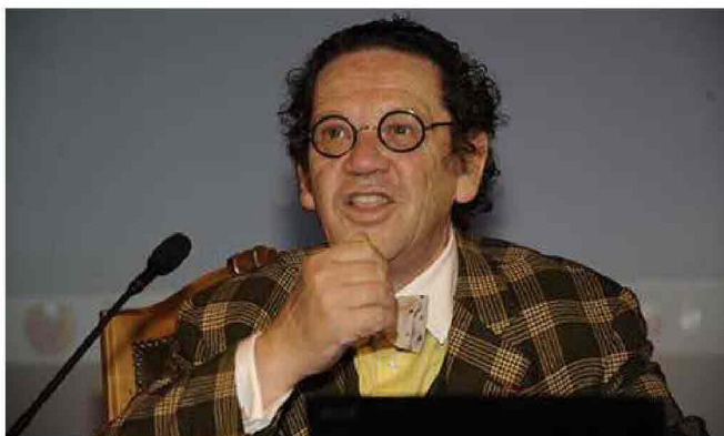
Philippe Daverio